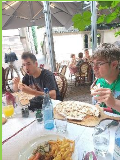
Flammkuchen, heerlijk zitten smullen.