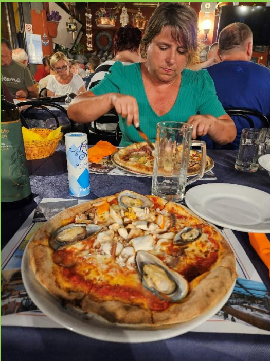
En aan het eind van een geslaagde dag heerlijke pizza.