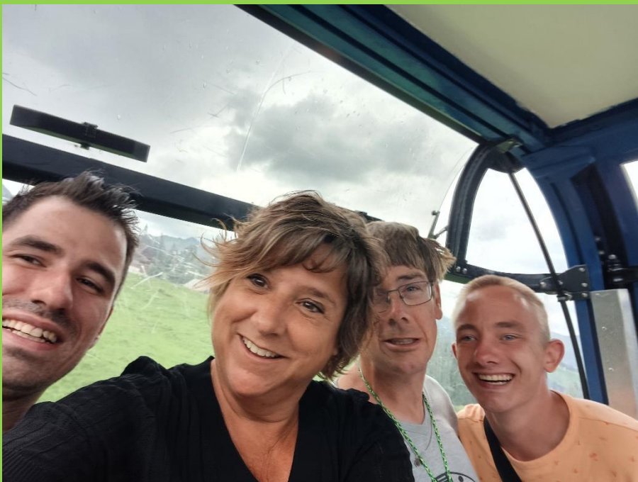
Lol in de kabelbaan!!