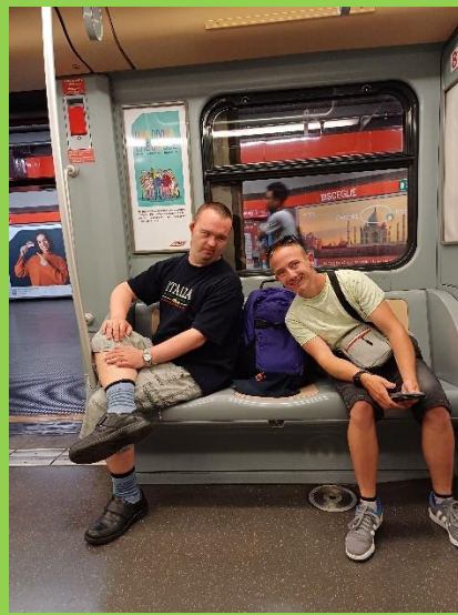
Metro in Milaan.