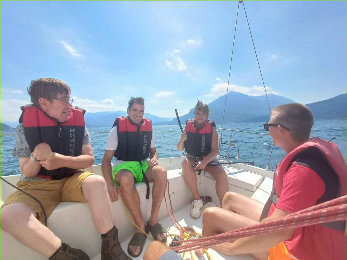
En snel dat we gingen.